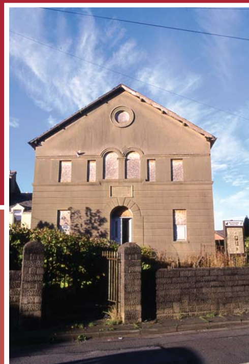
Hen Dŷ Cwrdd, Aberdâr

C odwyd capeli Cymru ar gyfer pregethu ynddynt, yn bwerdai cred a dysg, ac yn ganolfannau cydwybod a gweithredu cymdeithasol. Maent yn etifeddiaeth unigryw, yn ddiwylliannol a hanesyddol yn ogystal â chrefyddol. Wrth i'r niferoedd sydd yn addoli ynddynt leihau, daw llawer o'r adeiladau crefyddol hanesyddol yma yn ddiangen. Mae llawer mewn cyflwr bregus eisoes oherwydd diffygion cynnal a chadw, ond unwaith yn segur, dirywio'n gyflym yw eu hanes yn aml. Mae eu dymchwel neu eu trosi'n ansensitif yn golygu colli rhan o'n treftadaeth genedlaethol am byth.