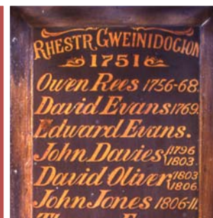
Rhan o restr gweinidogion, Hen Dŷ Cwrdd

Mae ein haddoldai hanesyddol yn rhan annatod o dirlun gwledig a threfol Cymru, ac yn adlewyrchu medrusrwydd crefftwyr a phenseiri. Cynrychiolant fywyd bob dydd cenedlaethau o bobl Cymru, o gyfnodau pan oedd yr adeiladau hyn yn ganolfannau gweithgareddau cymdeithasol yn ogystal â chrefyddol.