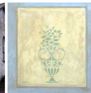
Panel addurnedig, Libanus

Blaen y daflen: Libanus, Llansadwrn, Sir Gaerfyrddin Lluniau deilen acanthws, addurn nenfwd a chofeb: Hen Dŷ Cwrdd