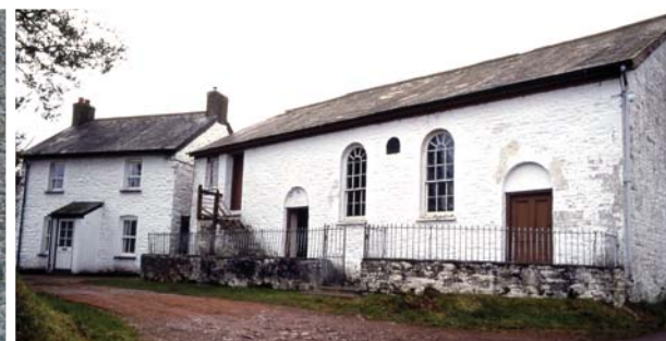
Capel Beili Du, Pontsenni