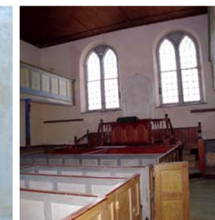
Tu mewn, tua'r blaen, Libanus