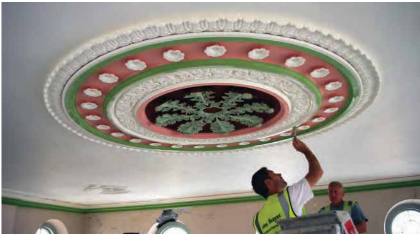
Trwsio'r nenfwd yn Hen Dŷ Cwrdd