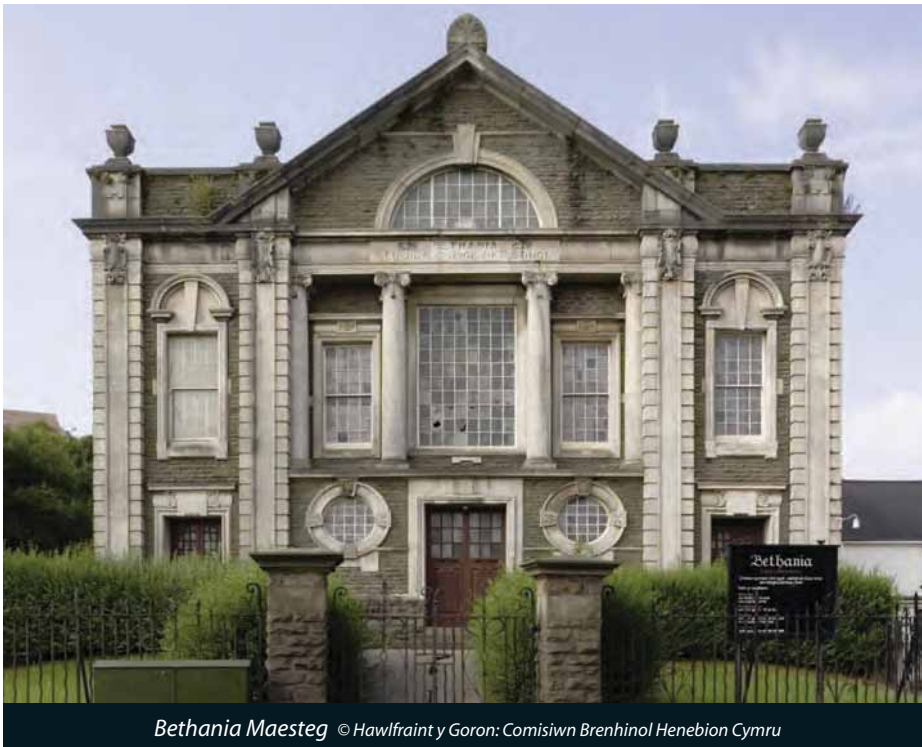
Bethania Maesteg