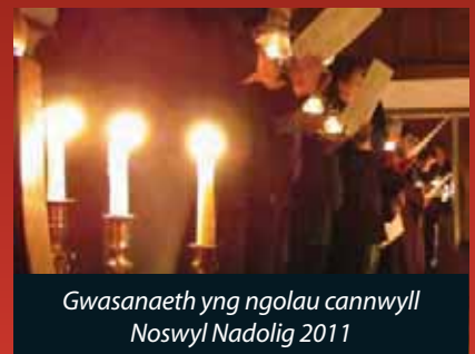
Gwasanaeth yng ngolau kannwyll Noswyl Nadolig 2011

Mae'r Ymddiriedolaeth wedi gwneud y nenfwd yn ddiogel, ac wedi ailgysylltu'r cyflenwad trydan fel y gellir cynnal digwyddiadau achlysurol yn ddiogel yn yr Hen Gapel, wrth i gynlluniau gael eu datblygu ac arian ei godi ar gyfer rhaglen lawn o waith atgyweirio. Adferwyd y traddodiad o gynnal gwasanaeth carolau yng ngolau kannwyll ar Noswyl y Nadolig y llynedd, a'r gobaith yw bydd yn ddiwyddiad blynyddol.