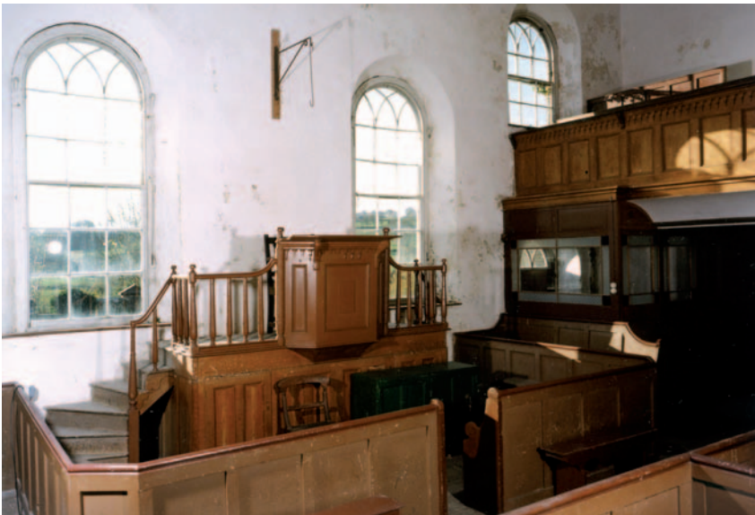
Tu Mewn Yr Hen Gapel, Llwynrhydowen

o'u bywoliaethau. Roed Gwilym Marles yn cefnogi diwinyddiaeth resymolaidd newydd Theodore Parker, gan olygu fod Llwynrhydowen 1860, fel yn 1733, yn parhau i dorri tir newydd.