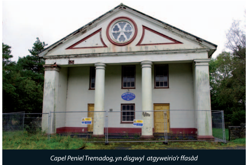
Capel Peniel Tremadog, yn disgwyl atgyweirio'r ffasâd