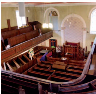
Capel Peniel Tremadog Tu Mewn

Mae hefyd angen cyfeillion a chefnogwyr lleol ar ein prosiectau amrywiol. Rydym yn croesawu gwirfoddolwyr lleol, i helpu i gadw llygad ar adeiladau, i helpu trefnu gweithgareddau achlysurol ac i agor adeiladau i'r cyhoedd ar ôl eu hatgyweirio.