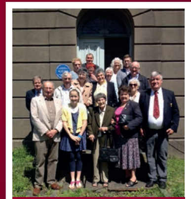
Y gynulleidfa yn Yr Hen Dŷ Cwrdd